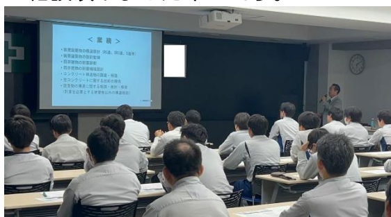
【RC 棚瀬代表講習風景】

当社のグループ会社である【RC コンサル】にコンクリートに関する外部講習の開催依頼がありました。コンクリートに関する基礎、設計、施工時におけるひび割れ抑制対策混和材を用いたひび割れ抑制対策の3部にて実施致しました。ひび割れ抑制に至っては、お客様を含めワンチームで取り組みそれぞれの立場で最善の方法を模索していく必要があります。講習会を開催、議論し技術の向上を図り施主様に喜んで頂ける構造物を造れるように意見交換をできればと考えております。ご希望がありましたらご相談頂けました幸いです。