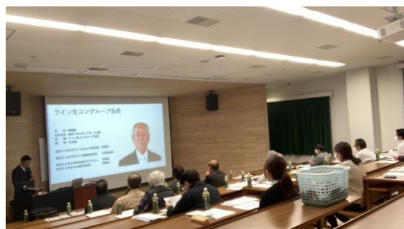
【横関副社長講習風景】